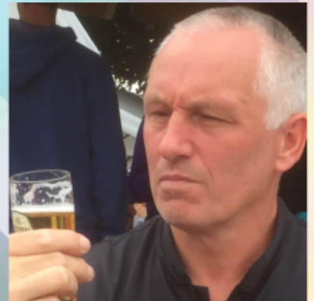
Lekker biertje toe