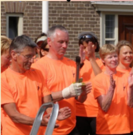
Nog even snel de lucifers erbij