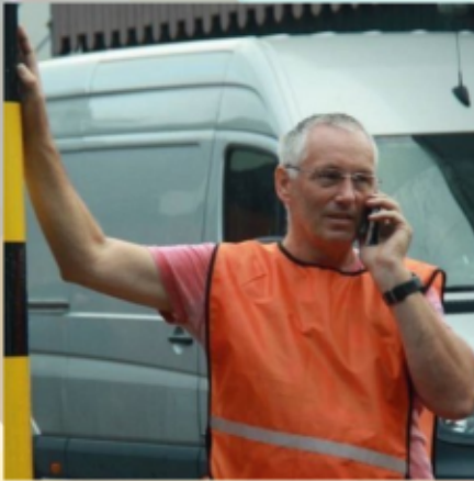
Even laatste belletje