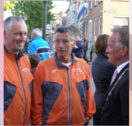
Complimenten van onze burgervader